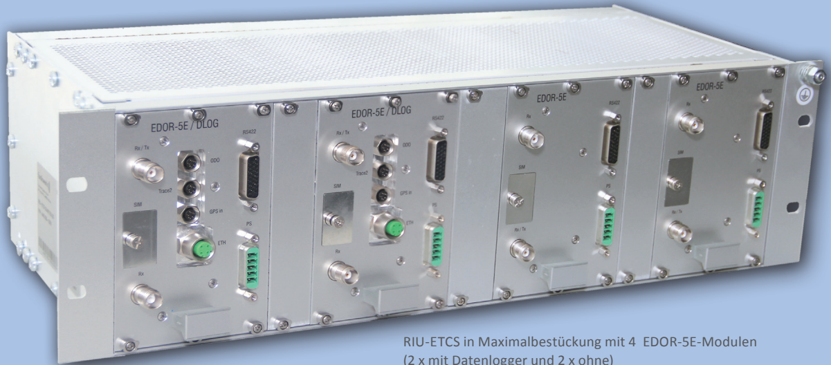
RIU-ETCS in Maximalbestückung mit 4 EDOR-5E-Modulen (2 x mit Datenlogger und 2 x ohne)